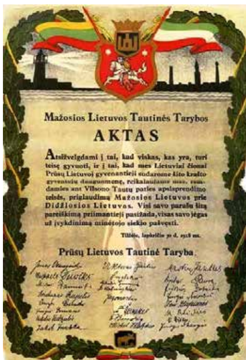
10 pav. Tilžės aktas. Spalvotas, meniškai paruoštas akto variantas, atspausdintas 1936 m. „Ryto“ spaustuviėje, Klaipėda.

Apgailestaujama, kad naujieji laikai lietuvininkų gyvenimo būdą, aprangą ir papročius per trumpą laiką pakeitė daugiau negu iki tol ištisi šimtmečiai. Net kilstelėję maža pakopa valdiškoje tarnyboje lietuvininkai nutautėdavo. Suvokietėjimas buvo laikomas geru ženklų vokiškos vyresnybės akyse. Lietuvininkams vis didesnės reikšmės turėjo Vokietijos aukštesnis ekonomikos ir kultūros lygis, vakarietiškos idėjos, protestantizmo dvasia. Protestantiškoji moralė nereikalavo nusizeminimo, savigraužos, paliko plačią veikimo laisvę, savo vertės supratimą, skatino gyventi be apgaudinėjimų, netiesos, žodžio netesėjimo, savalaikio ir sąžiningo darbų atlikimo. Visa tai lėmė, kad „Mažojoje Lietuvoje beveik nežinota buitinių žmogžudysčių, kitų sunkių nusikaltimų. Mažiau čia neteisybės, piktumo, neapykantos, girtavimo“ 10 . XIX–XX a. sandūroje lietuvių saugojo vienintelė bažnyčia. Pasišventėlių,