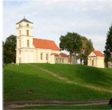
3 pav. XVII a. evangelikų liuteronų bažnyčia Jonušavoje.