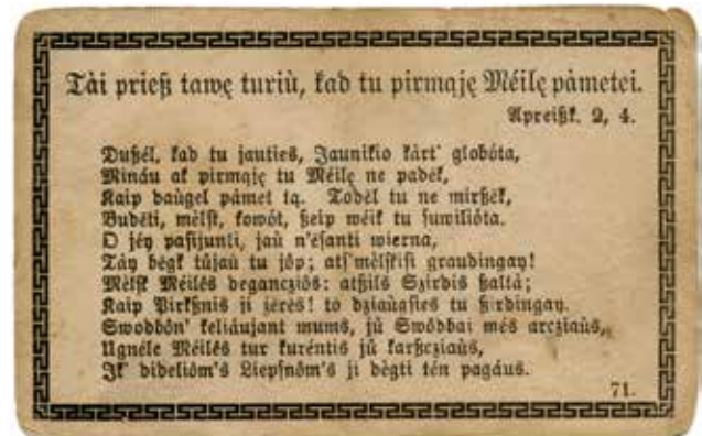
6, 7 pav. Burtikės. XX a. pr. Naudota Gerulių namuose Šilutės r. Vabalų k. (namas perkeltas į muziejų). LBM 50657, LBM 50658.

Norėdami muziejuje atskleisti lietuvininkų gyvensenos ypatumus, turėsime rodyti ne tik interjero naujoves, bet ir puošniąsias knygas, kalendorius, periodiką, bilderukus (paveikslėlius religine tematika), fotonuotraukas, atvirukus, atvirlaiškius, burtikes.