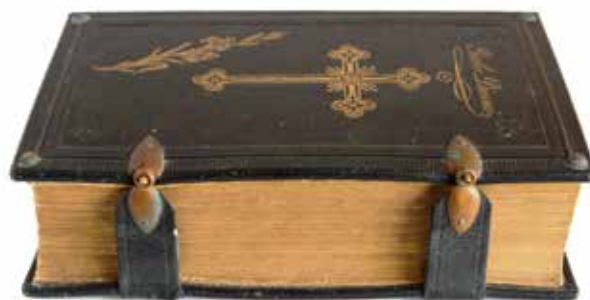
3 pav. Knyga „Asz bey mano Namai norim Wieszpacziui szluzuti“. Berlynas. 1914 m. Naudota Gerulių namuose Šilutės r. Vabalų k. (namas perkeltas į muziejų). LBM 50655.