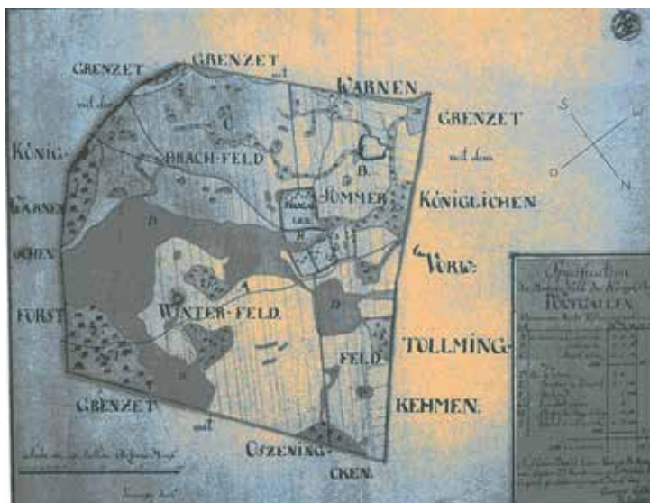
1 pav. Poreformaciniu laikotarpiu susiklostęs Pievgalių kaimas greta žinomojo Tolminkiemio XVIII a. pradžios plane, kuriame užfiksuota Mažojoje Lietuvoje susiklosčiusi būdingo lietuvininkų kaimo struktūra. Iš Rothe W., Wiemer D. Zur Siedlungsgeschichte von Preussisch-Litthauen... 2014.

Plane pavaizduota anuometinė kaimo naudotų plotų žemėnauda: žiemos laukas (A), vasaros laukas (B), pūdymo laukas (C), bendruomenės pieva (D). Laukai buvo sudalinti į atskiriems ūkiams priklausiusius rėžius (tuomet kaime gyveno bent trys stambūs ūkininkai ir keliolika smulkesniųjų). Netaisyklingo plano sodybos su padrikai išdėstytais pastatais buvo susitelkusios kaimo senajame branduolyje, supdamos XIV–XVI a. būdingą aikštę (neramiais laikais ir nakčiai į ją būdavo suvaromi turėti gyvuliai, dienomis išgenami į ganyklas). Pievgalių kaimo žemės pietvakariuose ribojosi su Varnių, šiaurryčiuose – su Ožininkų kaimų žemėmis, pietryčiuose – su karališkuoju Varnių mišku, šiaurvakariuose – su Tolminkiemio karališkojo palivarko valdomis. Aplinkinių kaimų valstiečiai tuomet priklausė ne privatiems dvarininkams, o karaliaus dvarui, kuriam turėdavo atlikinėti baudžiavines prievoles. Šis kaimas panašiai turėjo atrodyti ir XVI–XVII a., krašto lituanizacijos laikais ten kuriantis dešimtims naujakurių – išeivių iš baltiškųjų kraštų, vėlesnių lietuvininkų protėviams.