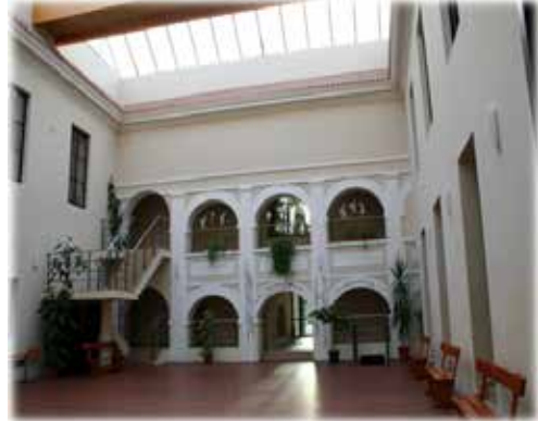
12 pav. Kėdainių rotušė pastatyta Jonušo Radvilos nurodymu 1654 m.