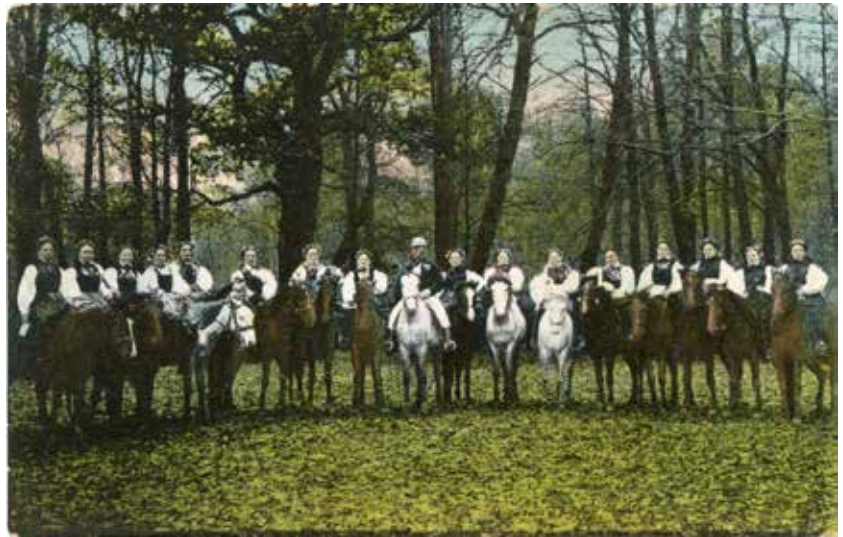
8 pav. Lietuvininkės tautiniais drabužiais. Mažosios Lietuvos istorijos muziejus.