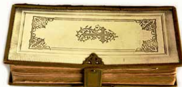
1 pav. Mišių knygos prieknygė. Tilžė. 1895 m. LBM 24759.